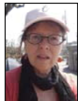
Das Gespräch führte Beate Sauer-Thiel

Hof Dolling, Im Dorfe 5, 27243 Beckstedt www.solawi-wildes-gemuese.de wildes.gemuese@posteo.de Irmtraud Keppler: 04244-967316