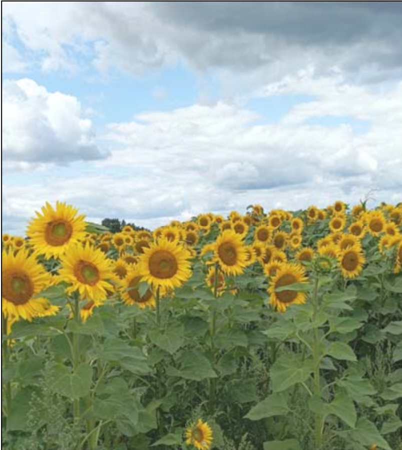
Sonnenblumenfeld in Beckstedt

Erntedankgottesdienste am 01.10. 9.30 Uhr Heiligenloh 18.00 Uhr Colnrade