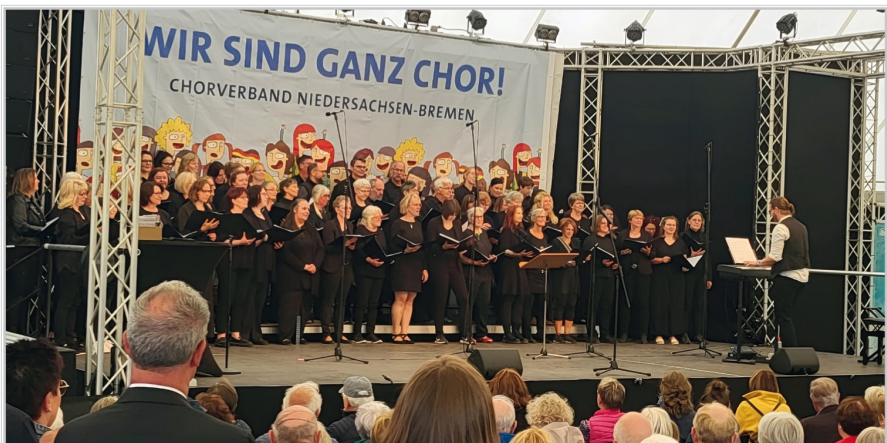
Auftritt in Bad Zwischenahn in Großformation, Juni 2024